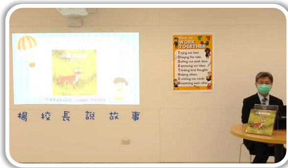
4/7 小狐狸回家 ▶

為配合防疫、減少群聚，楊校長說故事取消現場聆聽，改為兩週一次錄影方式，希望疫情中仍能持續帶給孩子們故事的能量！