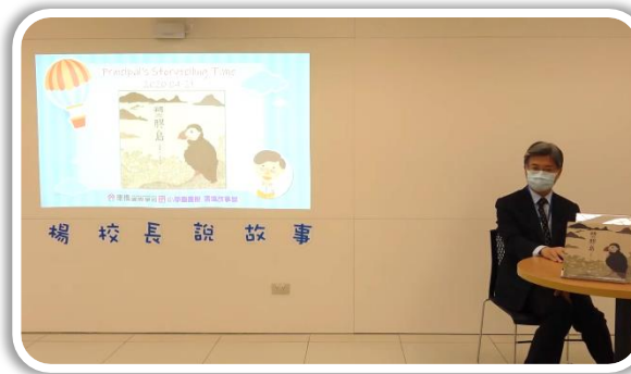
4/21 塑膠島 ▶