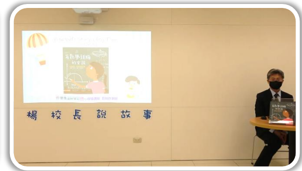
5/19 有數學頭腦的女孩 ▶